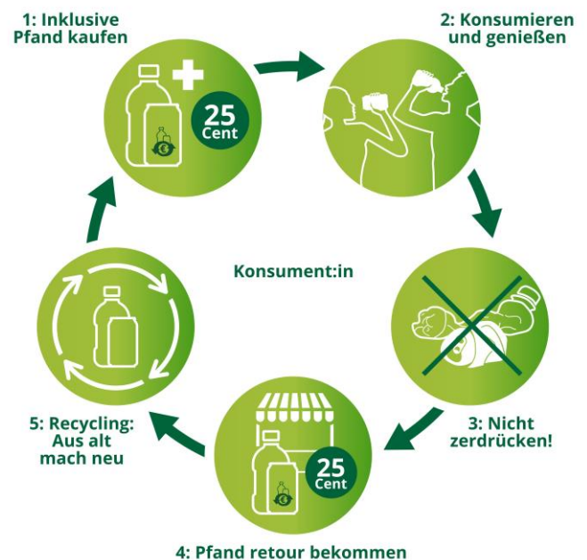
Bild: Pfandkreislauf