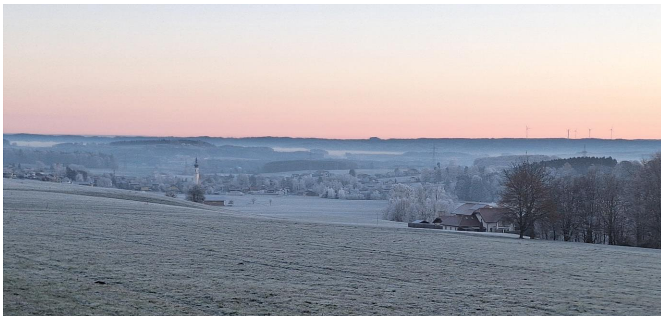
Morgenstimmung vom 2. Dezember 2024