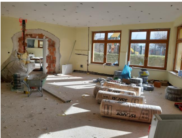
(Umbauarbeiten im alten Kinderteil)

Der Kindergartenneubau ist fertiggestellt. Mit den Umbauarbeiten im alten Teil des Kindergartens wurde bereits in den Semesterferien begonnen.