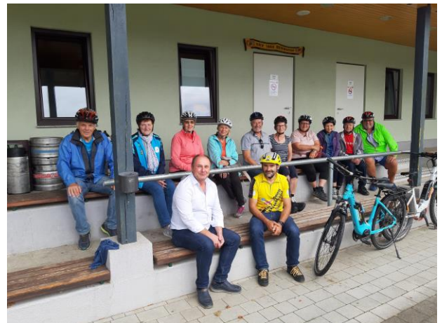
E-Bike Training-Teilnehmer vom letzten Jahr.

Diese E-Bike Training finden bei jedem Wetter statt. Sollte aufgrund der schlechten Witterung kein Radfahren möglich sein, werden Rad- und Helmchecks sowie die Theorieinhalte durchgeführt.