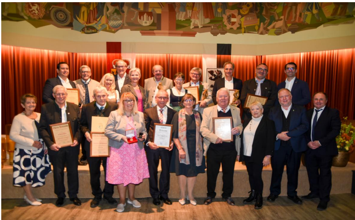
Ehrung verdienter Gemeindebürger Oktober 2025