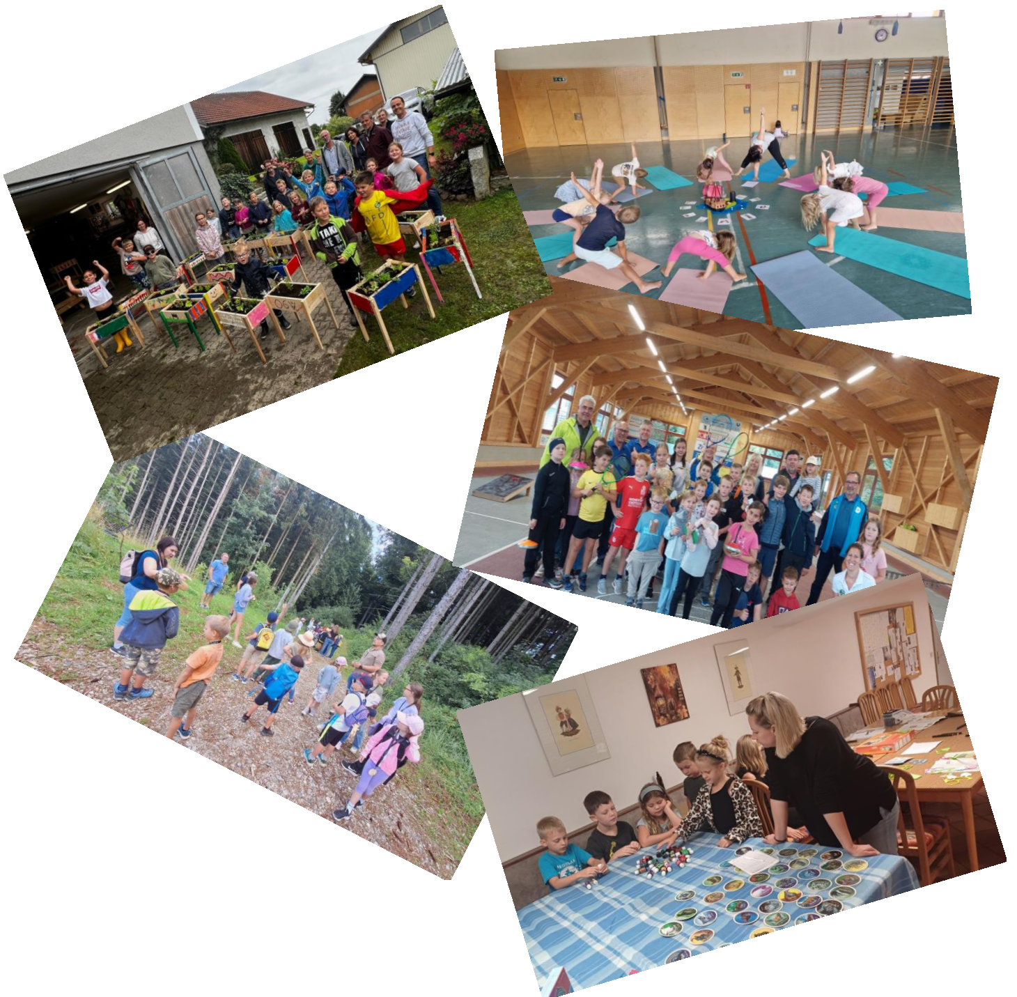
(Bilder von den diversen Vereinen und Institutionen)

Hier ein paar Fotos und Eindrücke von den Veranstaltungen. Mehr finden Sie auf der Gemeinde Homepage.