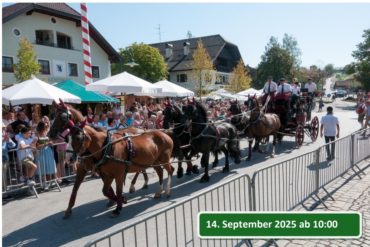
Pferdekutschengala 2023